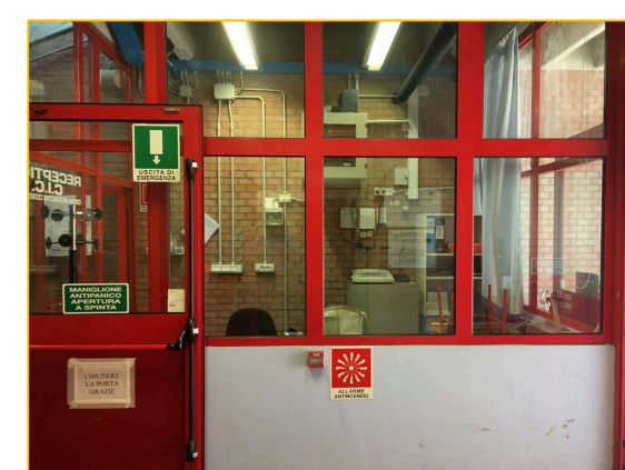
Esempio di vetro da installare